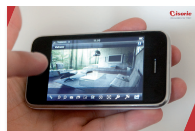
Virtual Reality Konfigurator auf dem iPhone