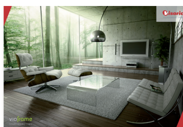
Rendern der Daten